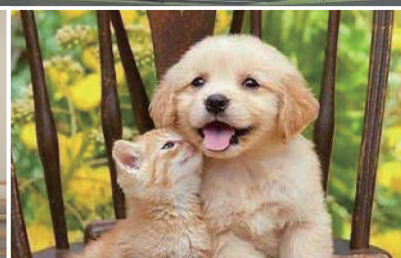
ペットとご入居OK ご入居時審査あり